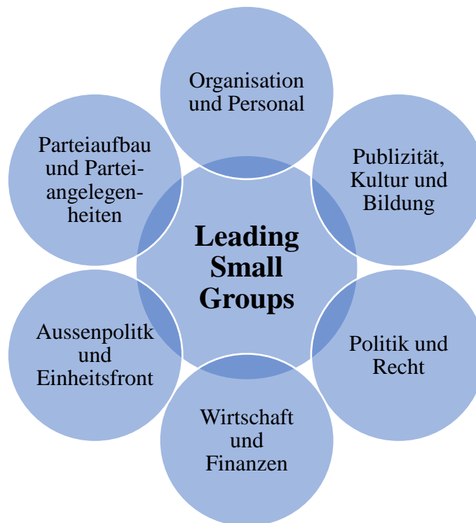
Abbildung 1: Kategorien von LSG.